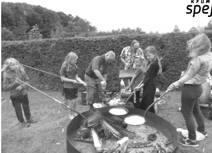
Bålpanderne blev flittigt brugt af de mange børn der kom forbi spejderbålet på Sct. Hansfestens familiedag.