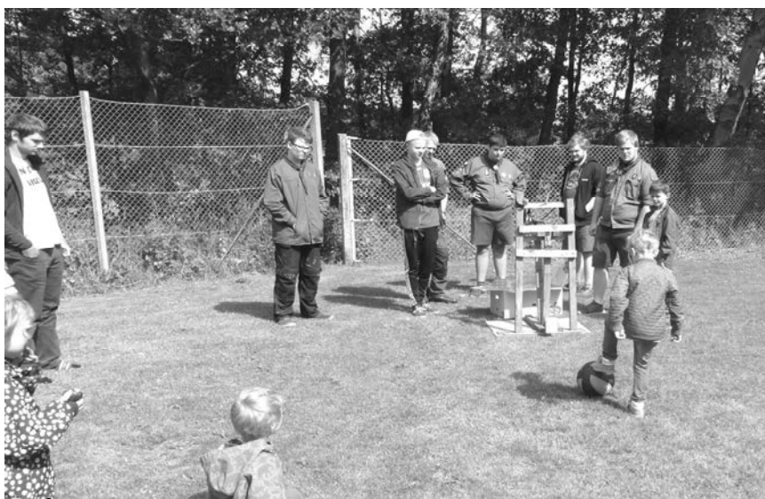
Også spejdernes flødebollekast var flittigt besøgt af de mange børn der efter en pandekage gerne ville nyde en flødebolle som dessert.