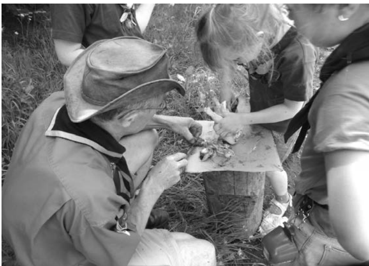
Det er spændende at være med til tage indmaden ud af en kylling og få en forklaring på hvad de enkelte indvolde er.